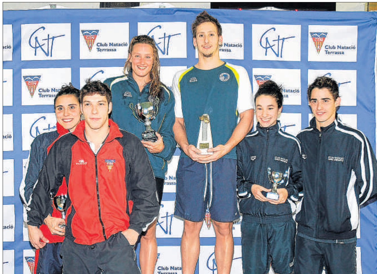
Els nedadors del CN Sabadell, el CN Terrassa i el CN Sant Andreu, al podi absolut

↳ El CN Sabadell va aixecar, diumenge passat, la copa de campió en categoria absoluta en el Campionat de Catalunya Open Internacional, celebrat al llarg de tres dies en el CN Terrassa i del qual se'n pot veure un reportatge a UFECtv ( www.ufec.tv ). L'equip sabadellenc va estar acompanyat al podi per l'amfitrió, el CN Terrassa, mentre que el CN Sant Andreu va acabar tercer. Pel que fa al campionat català en categoria júnior, el títol de campió va ser per al CE Mediterrani, que va quedar per davant del CN Sabadell, segon, i el CN Cornellà, tercer.